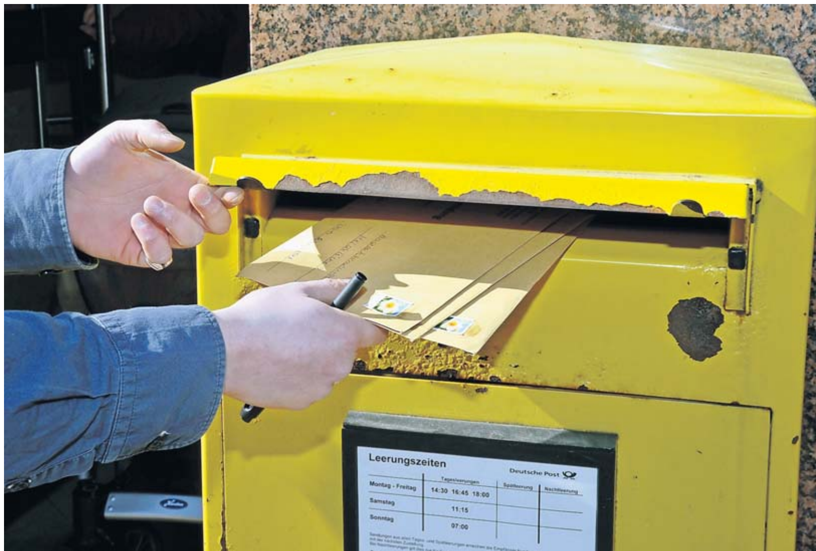
An der Hafestraße 195 bei der Post-Agentur Estandiar stehen zwei Postkästen – und dann lange nichts. Für viele Leher unzumutbar.

LEHE. Hausnotrufgeräte, Vorsorgevollmachten, Änderungen im Pflegegesetz – um Themen wie diese dreht sich ein Informationsnachmittag im Seniorentreffpunkt Altbürgerhaus in der Neulandstraße 48. Am Montag, 25. März, geht eine Mitarbeiterin eines Pflegestützpunktes auf verschiedene Hilfsmittel und Gesetzesvorschriften ein, die für Senioren wichtig sind. Interessierte sind willkommen. Die Veranstaltung beginnt um 15 Uhr. (nz)